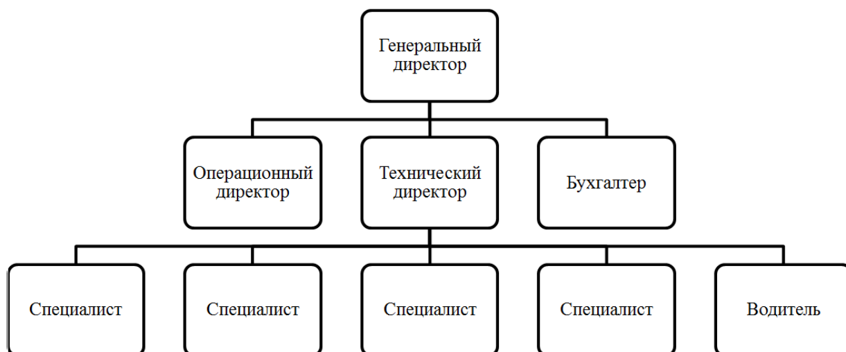
Рисунок 2 – Организационная структура управления ООО «Радар»