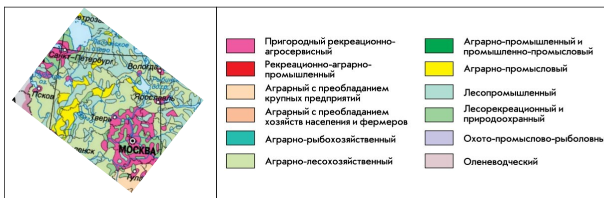
Рис. 1. Фрагмент карты «Типы сельской местности» в Национальном атласе России (т. 3, 2008. С. 136–137). URL: http://xn--80aaaa1bhnlccci1cl5c4ep.xn--p1ai/cd3/136-137/136-137.html