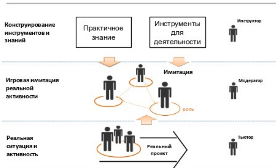
Рис. 5. Представления о способе реализации игры как форме сочетания всех возможностей в образовании

Пользуясь данными фрагментами презентации, а также используя поисковую деятельность в сети Интернет, докажите, что образовательные учреждения России, ближнего и дальнего зарубежья реализуют в своей деятельности указанные направления новой образовательной модели.