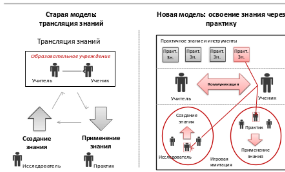
Рис.4. Представления о способе реализации нового формата образования