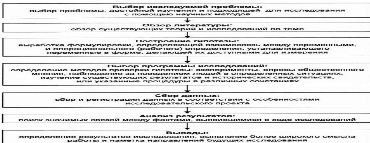
Рис. 1.6. Этапы социологического исследования

1. Подготовьте доклад на семинарское занятие, используя следующий план.