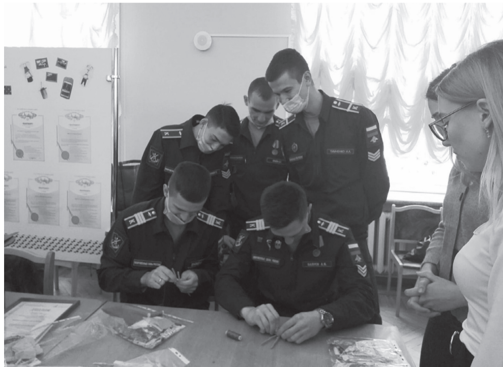
Слушатели ПВО на мастер-классе по изготовлению козы