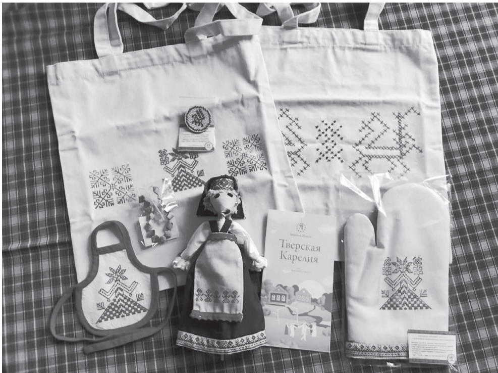
Линейка карельских сувениров

Наступивший год будет посвящен культурному наследию народов России – так следует из указа президента страны Владимира Путина. Решение принято в целях популяризации народного искусства и сохранения культурных традиций, памятников истории и культуры, этнокультурного многообразия, культурной самобытности всех народов и этнических общностей.